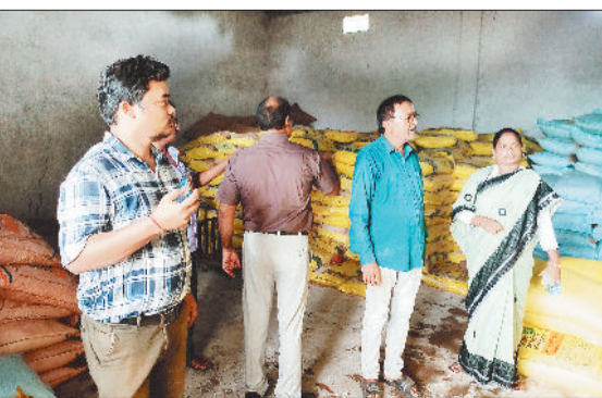
समिति पहुंचे अधिकारी नेता।