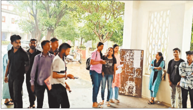
कॉलेज द्वारा जारी मेरिट सूची में अपना नाम खोजते विद्यार्थी।

राजीव गांधी पीजी कॉलेज में पिछले दो सालों से नई शिक्षा नीति के तहत निर्धारित पाठ्यक्रम का संचालन किया जा रहा है। पिछले साल कॉलेज ने एसजीजीयू के माध्यम से प्रवेश का पंजीयन कराया था जिससे कुछ बाधाओं का सामना करना पड़ा। इस बार कॉलेज ने स्वयं की वेबसाइट पर प्रवेश के लिए पंजीयन कराया था। पंजीयन की तिथि 30 जून तक निर्धारित थी। प्रथम चरण की प्रवेश प्रक्रिया में स्नातक कक्षा के 850 सीटों के लिए 1321 छात्र-छात्राओं ने पंजीयन कराया था। इसी तरह स्नातक विज्ञान अंतर्गत गणित संकाय की 275 सीटों के लिए मात्र 262 आवेदन, विज्ञान बायो संकाय की कुल 250 सीटों के लिए सर्वाधिक 1075 तथा स्नातक वाणिज्य संकाय की 440 सीटों के लिए 615 एवं बीसीए की 60 सीटों के लिए 179