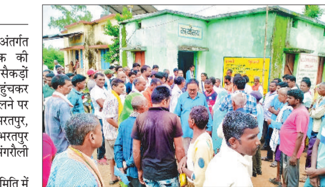
खाद के लिए किसानों की भीड़।

इस दौरान किसानों ने बताया कि समिति में पर्याप्त खाद रखी हुई है, लेकिन समिति प्रबंधक हम लोगों को खाद नहीं दे रहा है और चोरी छिपे रात के अंधेरे में ब्लैक कर रहा है। हम किसान खाद लेने के लिए पिछले एक पखवाड़े से लगातार समिति में आ रहे हैं और घंटों खड़े रहने के बावजूद समिति प्रबंधक द्वारा तरह-तरह का बहाना ▶▶ शेष पेज 4 पर