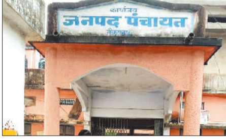
जनपद पंचायत बैकुंठपुर व सोनहत।

जनपद पंचायत सोनहत में 11,45,776 की बकाया राशि से जुड़े प्रकरणों की पहचान की गई थी। प्रशासन ने सक्रियता दिखाते हुए इस राशि में से 8,47,776 वसूल या समायोजित कर लिया है। फिलहाल 2,98,000 की राशि शेष है। यहां बकायादारों की संख्या पहले 12 थी, जो घटकर अब सिर्फ 2 रह गई है। जनपद पंचायत बैकुंठपुर में बकाया राशि का ऑफडा कर्माधिकारी था। यहां 63,30,000 के प्रकरण दर्ज किए गए, इनमें से 32,33,379 की वसूली हो चुकी है। वर्तमान में 30,94,600 की ▶▶ शेष पेज 4 पर